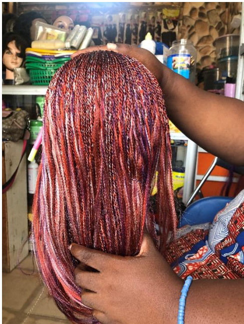
Coiffure (Perruques sur mesure)