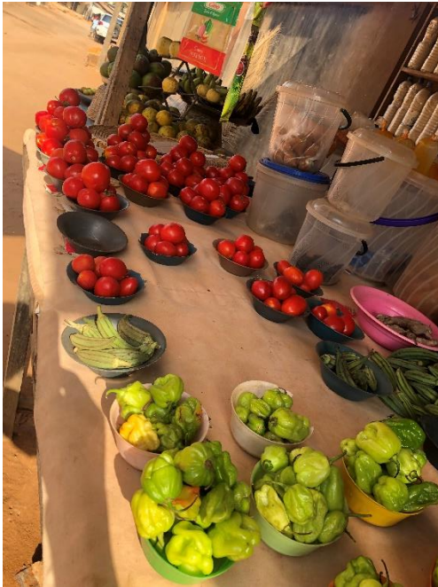
Fruits et légumes