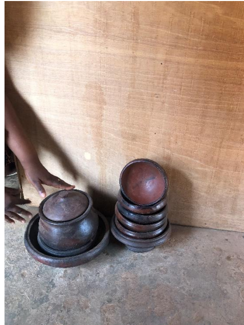
Bols en terre cuite