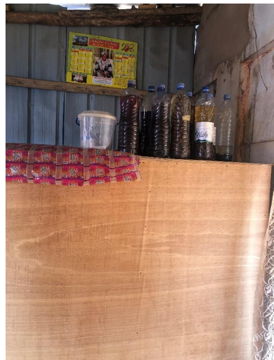
Boissons locales (sodabi aromatisé)